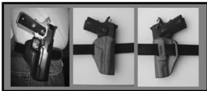
На поясе вид спереди вид сзади

Эта конструкция характеризуется двумя щелями сзади для ремня, чтобы прижать заднюю часть пистолета к телу для большей скрытности. Уровень натяжения регулируется подгонкой или приспособлением для регулирования натяжения. Большинство кобур данной версии характеризуются наличием толстой тесьмы на верхней части, что облегчает выхватывание оружие одной рукой; оружие носится в вертикальном положении (не под углом). Типичными