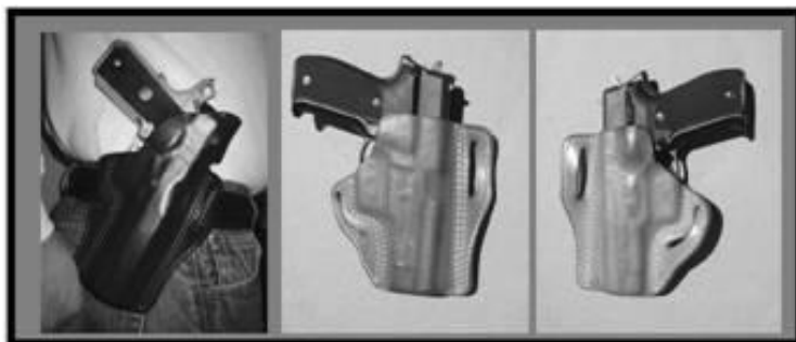
На поясе вид спереди вид сзади

В основе данного дизайна – два отдельных плоских куска кожи, скрепленных ремнем через щели на обеих сторонах «кармана», в который помещается оружие. При таком варианте оружие крепко прижато к телу и хорошо скрыто и безопасно расположено. Плоские кобуры, как правило, самые удобные и скрытные. Они носят на внешней стороне ремня, и оружие в такой кобуре направлено назад (под углом). Типичными представителями данного вида являются кобуры TheGalco Combat Master, Dillon Master и De Santis Speed Scabbard. Все версии Плоских Кобур допущены к соревнованиям.