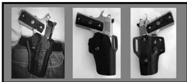
На поясе вид спереди вид сзади

Эта кобура представляет собой «карман», в который помещается оружие и имеет заднюю часть, посредством которой присоединяется к ремню. Эта часть может быть прорезью для ремня, щелями для ремня на каждой стороне «кармана» или пластинкой, которая вставляется в брюки. Данный вид часто делается из синтетических материалов и является наименее скрытным из четырех видов, перечисленных здесь. Натяжение почти всегда регулируется с помощью винтика. В большинстве кобур в виде мешка пистолет расположен вертикально (не под углом). Этот вид, пригодный для скрытого ношения оружия, также во многих случаях хорошо себя показывает на соревнованиях. Большинство кобур данного типа, представленных на рынке, НЕ подходят для использования на соревнованиях. Из данного типа следующие кобуры отвечают предъявляемым требованиям: The Safariland model 5183, Wilson Combat Practical и the De Santis Pro Fed.